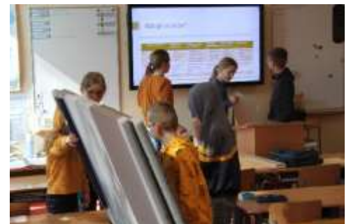
Groep 7: Het reisbureau