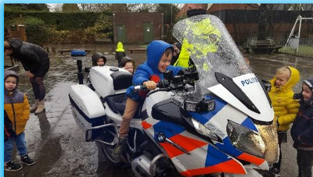
Politiebezoek bij de kleuters!