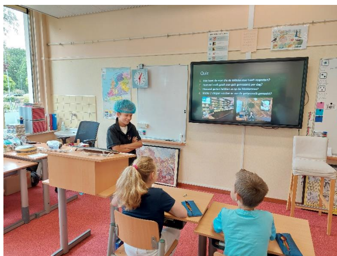
Een spreekbeurt in groep 6

Het praktijkexamen vindt plaats op 7 juni a.s.